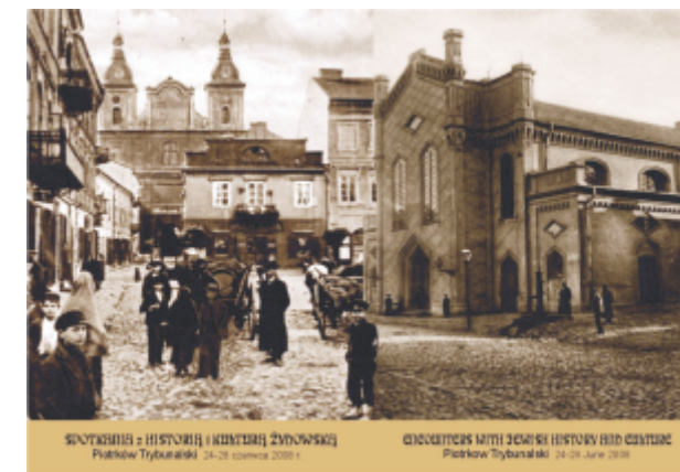
SYNAGOGA I HISTORIA ŻYDÓW PIOTRKÓW TRYBUNALSKI 24-25 czerwca 2009 r. SYNAGOGA I HISTORIA ŻYDÓW PIOTRKÓW TRYBUNALSKI 24-25 czerwca 2009 r.